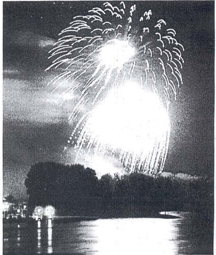
Lichterspiel zwischen dem Himmel und dem Wasser — so schließt Jahr für Jahr funkelsprühend das Inselfest ab.

Und wer bei „Kärntnerlandtrio“ gedacht hat, die Jungs könnten nur reine Volksmusik spielen, hat sich schon geirrt. Denn die vielseitige Gruppe wird auch ein Allroundprogramm mit Star-Imitationen und modernen Songs bieten.